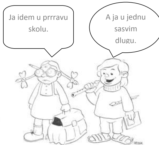
Slika 2: Poziv roditeljima na izbor škole u Nizozemskoj

će upisati svoje dijete. Škole su financirane prema broju upisane djece. To je ono što bi trebalo karakterizirati svako demokratsko društvo. Tako je u Evropi ponovno reafirmirana otvorena škola i uveden školski pluralizam. Evo kako u Nizozemskoj nude roditeljima izbor škole: