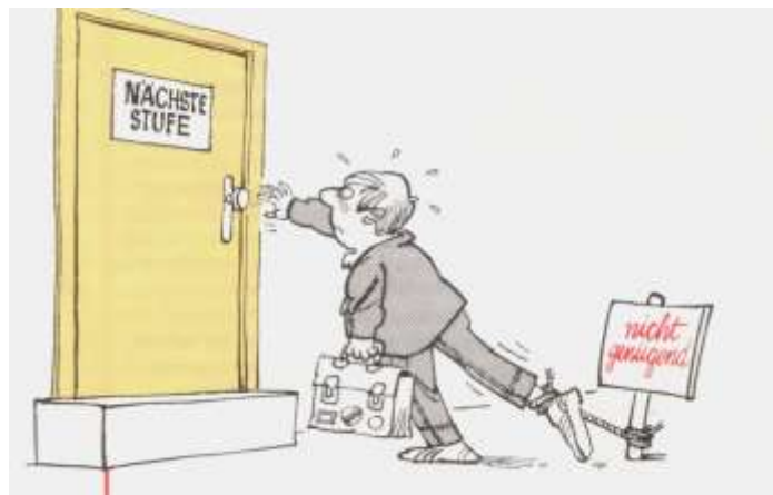
Slika 3: Ponavljanje razreda nikako nije u funkciji osobnog razvoja i samoaktualizacije

Najteže promjene na kojima čini mi se još niste počeli su one koje se moraju dogoditi u nastavi jer nastava čini 90% onoga što se događa u školama. Ako nastava ostane tradicionalna predavačka u kojoj, kako to reče jedna učenica, najprije nastavnik nešto priča učenicima, a onda oni to isto moraju pričati njemu to će ipak ostati represivna škola ma koliko mi odgajali za nenasilnu komunikaciju jer takvo neprirodno učenje se i ne može odvijati bez raznih vidova prisile kao što su negativne ocjene, razne disciplinske mjere, ponavljanje razreda. Evo još jedna kritika na tu temu iz Austrije: